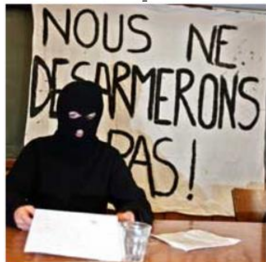
A l'université de Rennes

Ne vous méprenez pas. Si le protagoniste présent sur la photo porte une cagoule, c'est qu'il fait très froid dans le local où le cliché a été pris.